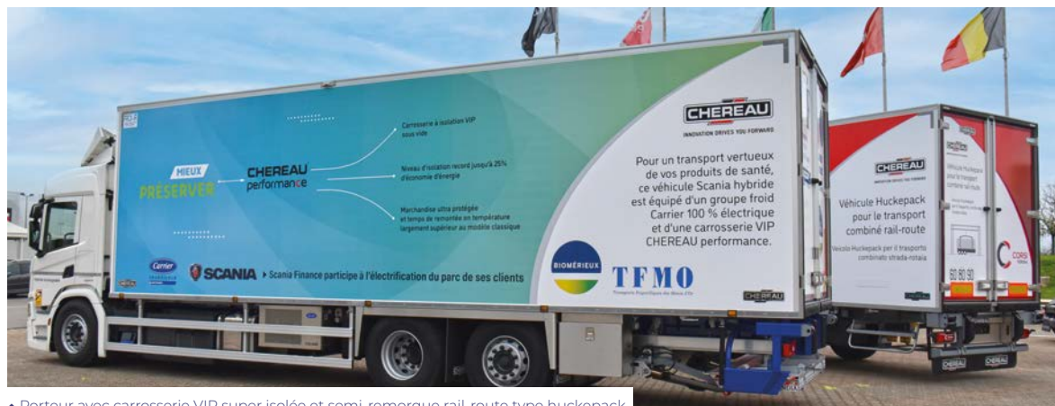
▲ Porteur avec carrosserie VIP super isolée et semi-remorque rail-route type huckepack.

En France, le parc de 30.900 semi-remorques frigorifiques avec groupe froid diesel émet chaque année 500.000 tonnes de CO 2 , rien que pour la production de froid.