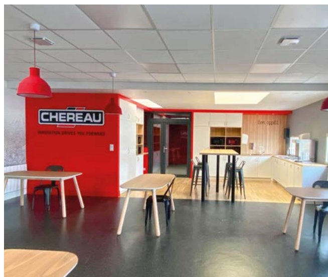
▲ Cette année encore de nombreux locaux ont été réaménagés pour le bien-être des collaborateurs.

« Au-delà d'avoir gagné la première édition de ce concours, nous sommes contents de pouvoir participer, à notre échelle, à la réduction des déchets parce que l'environnement est un sujet important pour tous. Ce concours est un bon moyen pour que l'ensemble des collaborateurs s'investissent. »