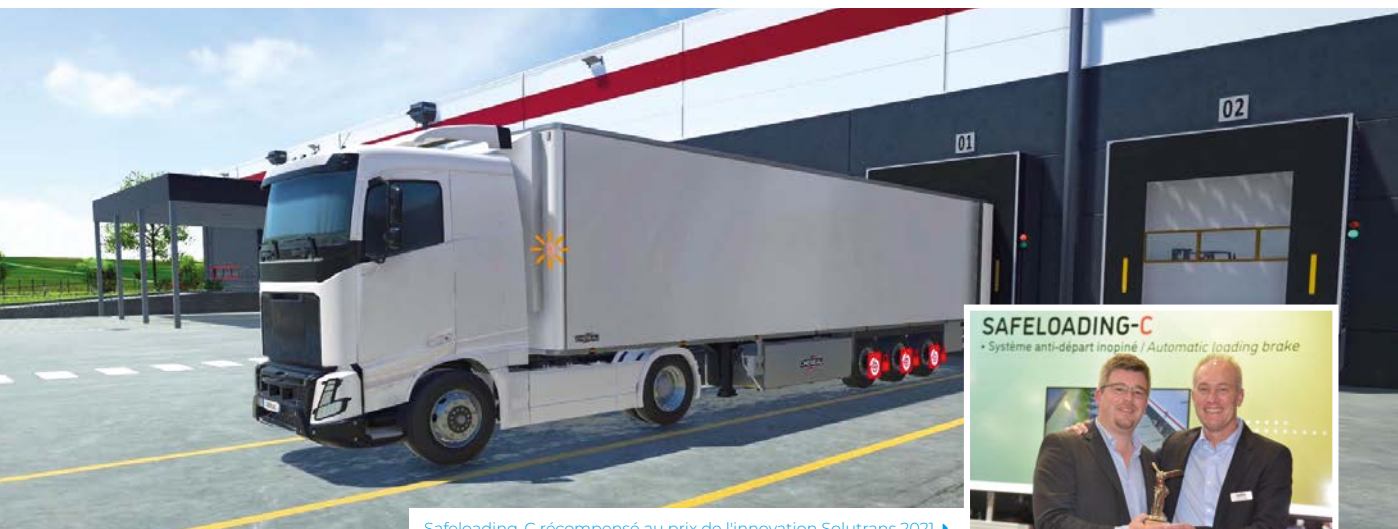
Safeloading-C récompensé au prix de l'innovation Solutrans 2021 ▶

Une innovation dédiée à la sécurité des opérateurs de quai qui chargent et déchargent les véhicules.