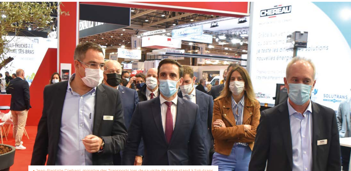
▲ Jean-Baptiste Djebarri, ministre des Transports lors de sa visite de notre stand à Solutrans.

Le contexte d'augmentation sans précédent des coûts des matières premières est venu profondément bousculer nos convictions et nos engagements.